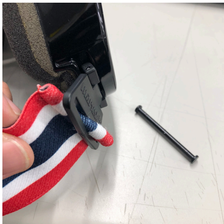
③外れたらベルトを入れ替えます。