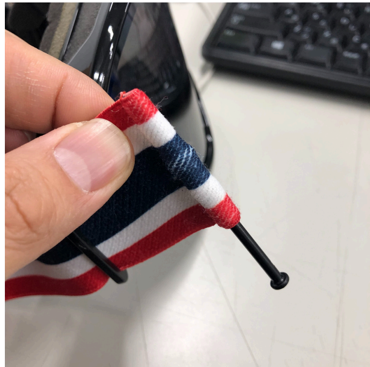
②ベルトの上部をおさえながら ピンを引き抜きます