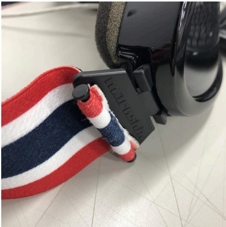
①こちらのピンを外します。